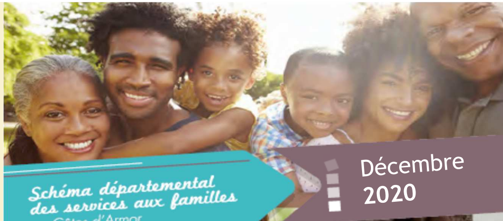
Schéma départemental des services aux familles en Côtes d'Armor