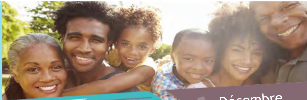
Schéma départemental des services aux familles en Côtes d'Armor