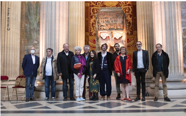
Un peuple de lecteurs - Panthéon, Paris 5 juin 2021